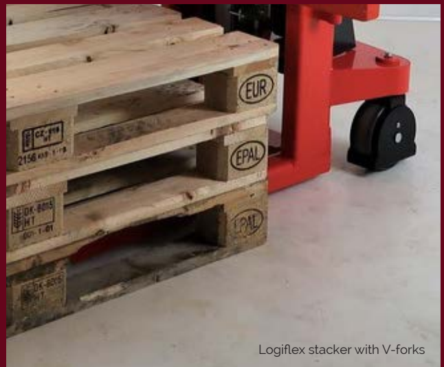
Logiflex stacker with V-forks